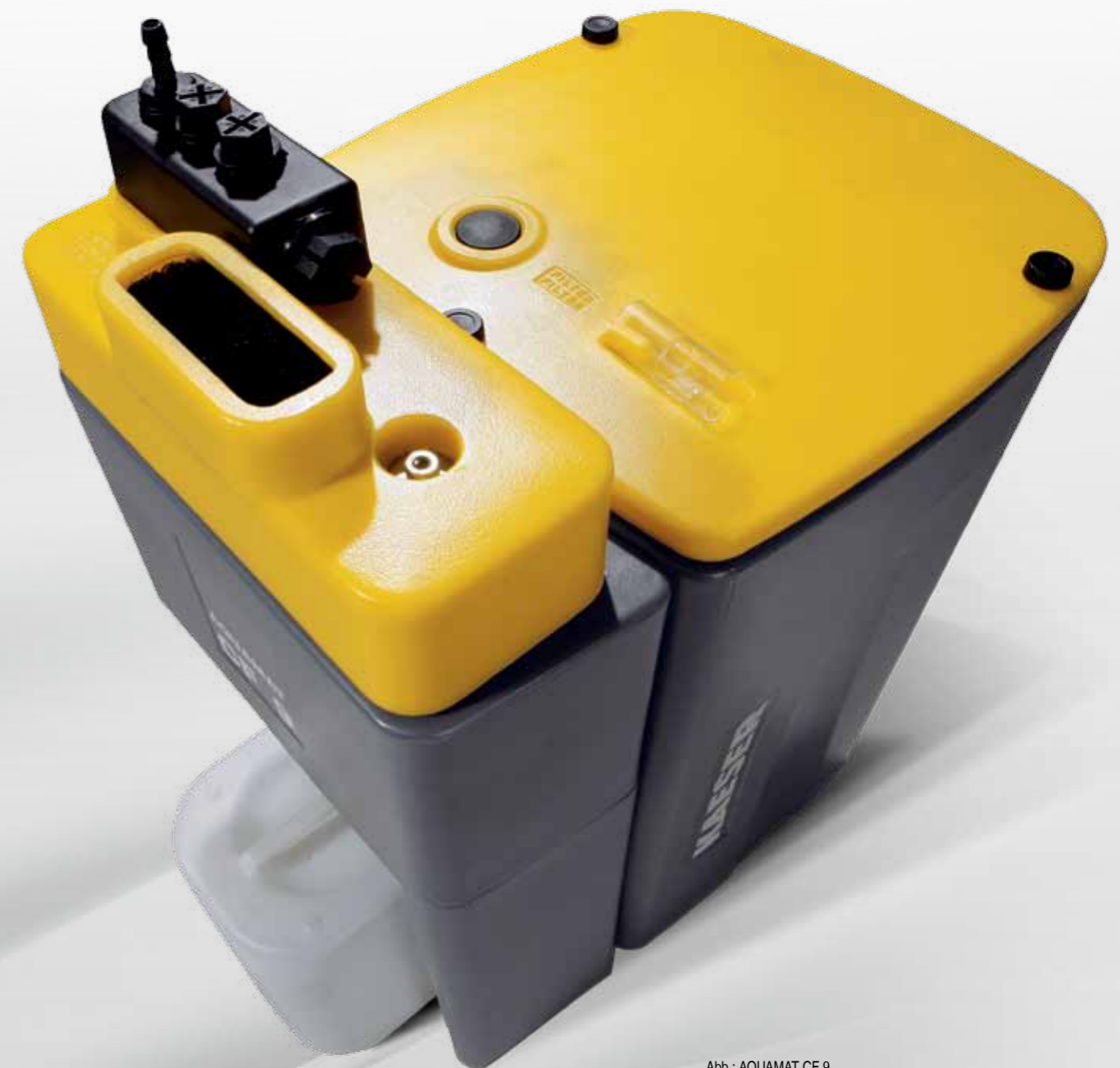
Abb.: AQUAMAT CF 9